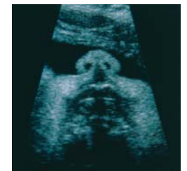
Imagen de ojos / nariz del feto