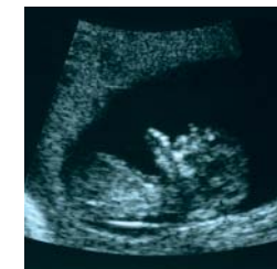
Bebé chupándose el dedo